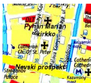
Pyhän Marian kirkko, Pietari